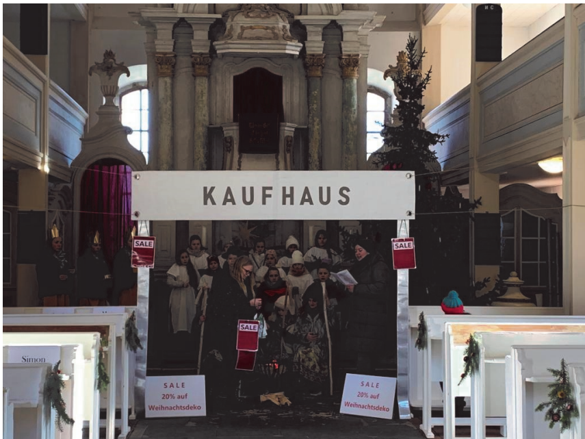
Generalprobe Krippenspiel in Gröst