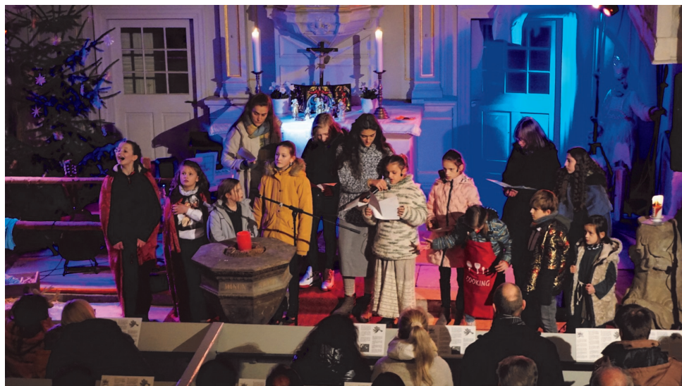
Krippenspiel in Krumpa Heilig Abend